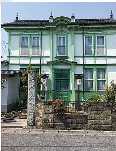
金光LC事務局が 国指定重要文化財の 定金家へ移転