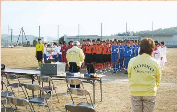
第1回浅口地区「金光LC杯」 中学校サッカー大会開催